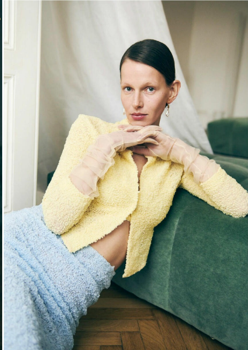
Cardigan und Rock von N°21. Handschuhe von Amazon Fashion. Perlenohrringe von Yana Nesper.