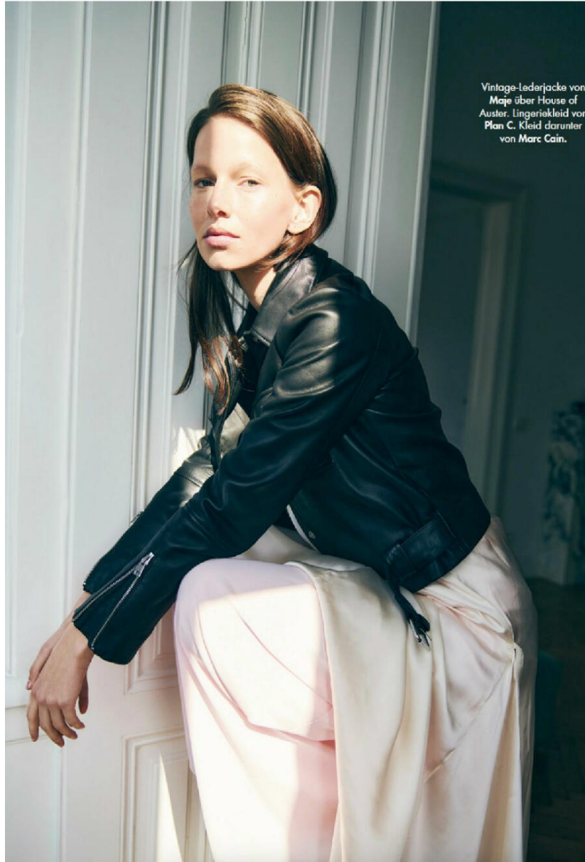
Vintage-Lederjacke von Maje über House of Auster. Lingerikleid von Plan C. Kleid darunter von Marc Cain.

HEIGHT : 5'10 BUST : 32.5 WAIST : 24.5 HIPS : 36 SHOES : 5.5 EYES : GREEN HAIRS : BROWN